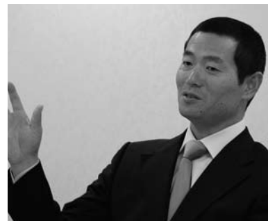
【くわたますみ】 1968年兵庫県生まれ。PL学園で1年から甲子園5回連続出場し、優勝2度、準優勝2度の原動力に。1986年ドラフト1位で巨人軍に入団。2006年、米メジャー挑戦のため退団するまで通算173勝を挙げた。2007年ピッツバーグ・パイレーツとマイナー契約を結び、同年6月にメジャー初登板。2008年に現役を退き、翌年4月早稲田大学大学院スポーツ科学研究科に入学。

そういう指導者の方に、もっと合理的で効率的な指導が必要じゃないのかと言うと、「いや桑田さんは、すごい練習をし